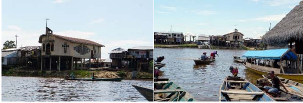
Die Menschen leben in meist kleinen Siedlungen entlang der Flüsse, die in den Amazonas münden.