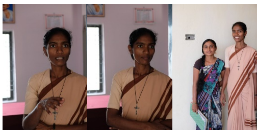
DSCF3099.jpg DSCF3101.jpg DSCF3186.jpg