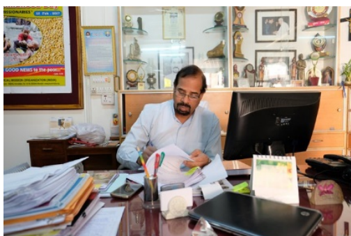
«Missio hat eine wichtige Rolle, indem sie den missionarischen Eifer weckt.»