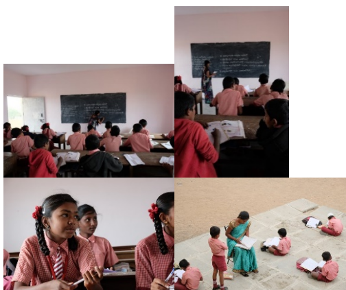
Um einen guten Schulerfolg zu garantieren gibt es pro Klasse nicht mehr als 40 Kinder.