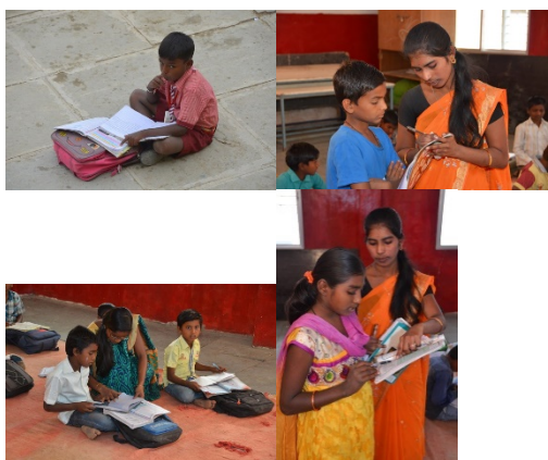
Begleitung der Schülerinnen und Schüler, Hilfe bei den Aufgaben und Vieles mehr gehören in der Schule der Schwestern selbstverständlich dazu.