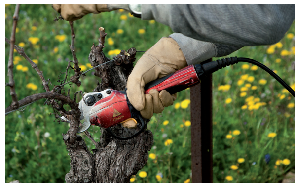
Winzermesser anstatt Lanze.

Wenn wir uns seiner Anziehungskraft nicht entziehen und uns nicht ablenken lassen, ziehen wir nicht mehr mit dem Schwert unserer Besserwis-