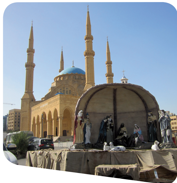
Die Bilder auf dieser Seite gehören zum Folienset «24 Bilder aus dem Libanon»; siehe Seite 15.

Ein wichtiges Ziel der Sternsinger und ihrer Projektpartner im Libanon ist es deshalb, Frieden und Verständigung zwischen Menschen unterschiedlicher Herkunft, Kulturen und Religionen im Libanon zu fördern.