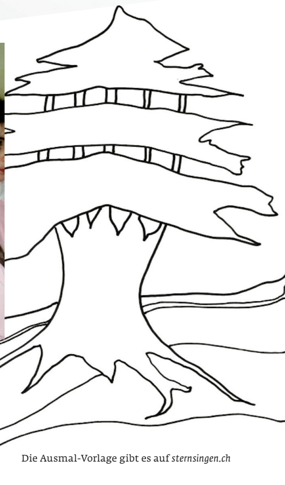
Die Ausmal-Vorlage gibt es auf sternsingen.ch

Alle Bilder, die wir bis Ende März 2020 bekommen, werden in den Libanon geschickt. Kinder aus den unterstützten Missio-Projekten werden sich über die farbigen Botschaften bestimmt freuen.