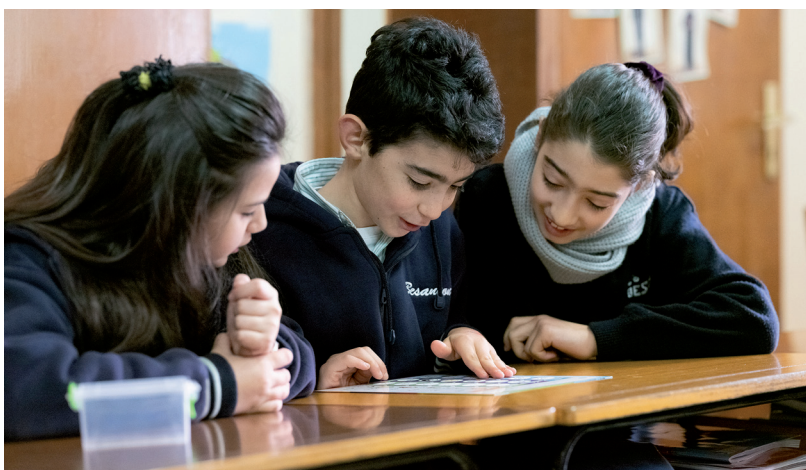
Im Alwan-Unterricht lernen Schüler im Libanon religiöse und kulturelle Vielfalt, Frieden und Gerechtigkeit kennen – die Basis für ein gewaltfreies und friedliches Miteinander.

Zerstörte Häuser erinnern bis heute an den Bürgerkrieg, der von 1975-1990 wütete. Seither gelingt dem kleinen Land des Vorderen Orients weitgehend ein demokratisches und friedliches Zusammenleben. Doch die derzeitigen wirtschaftlichen und sozialen Herausforderungen könnten diesem Frieden ein Ende bereiten; der Libanon hat in den letzten Jahren sehr viele Flüchtlinge aus den Nachbarländern Syrien und Palästina aufgenommen und verzeichnet dadurch einen enormen Bevölkerungszuwachs: Nach eigenen Angaben kommen zu den 4.5 Mio. Libanesen 2.4 Mio. geflüchtete Menschen. Die Menschen im Libanon stehen vor der Herausforderung, trotz Ressourcenknappheit, einer konfliktreichen Vergangenheit und den kriegerischen Auseinandersetzungen in den Nachbarländern den Frieden zu bewahren. Das bedingt, dass die Menschen im Libanon trotz ihrer kulturellen, konfessionellen und religiösen Verschiedenheit offen aufeinander