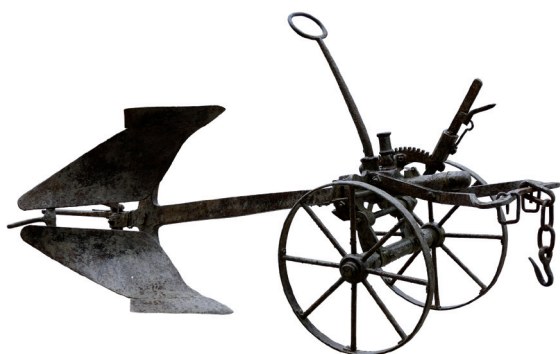
Pflugscharen aus Schwertern

Jesaja erinnert uns daran, dass wir bei Gott finden, wonach unser Herz sich im Tiefsten sehnt. Dann können wir unsere Schwerter getrost in Pflugscharen umschmieden.