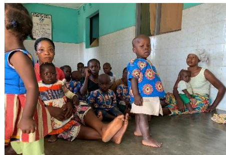
Bambini in orfanotrofio

Nell'orfanotrofio di Gouecké, sono accolti 50 bambini; soffrono di molti disturbi tra cui la malnutrizione.