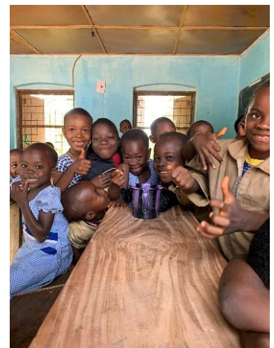
Bambini in pausa

Non appena le suore lasciano il locale, le ragazze corrono a giocare e ridere; sono felici di posare per le immagini.