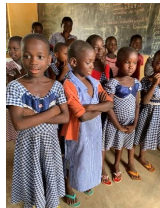
Amicizia tra ragazze

Le ragazze sono molto legate l'una all'altra, anche se sono di età diverse. Vivono infatti molti momenti insieme, come la preghiera, i pasti e le notti in dormitorio. Giocano, sono come sorelle... a volte anche con litigi tra di loro.