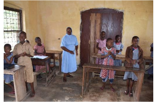
In una classe

Le ragazze ci accolgono con filastrocche e canti; ci sorridono e sono curiose per la nostra presenza. Non sono abituate a vedere estranei.