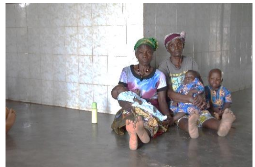
Nonne cullano i bambini

Alcune anziane vengono su base volontaria per prendersi cura dei bambini e li cullano. Sono come nonne di questi piccoli che hanno tanto bisogno di affetto.