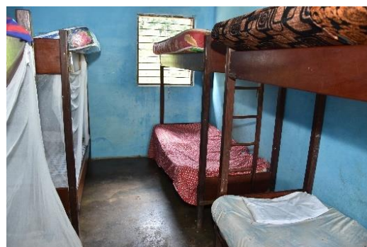
Dormitorio da ingrandire

Nel dormitorio, le ragazze stanno in 4 o 5 in ogni letto a castello. Le suore vorrebbero costruire un secondo dormitorio per permettere loro di vivere in modo più dignitoso e di avere un minimo di intimità.