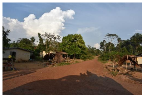
Strade della Guinea

Non è facile raggiungere i diversi luoghi dei progetti di Infanzia Missionaria ! Questi due progetti si trovano nella regione di Nzerekoré, nella Guinea forestale, situata nel sud del paese !