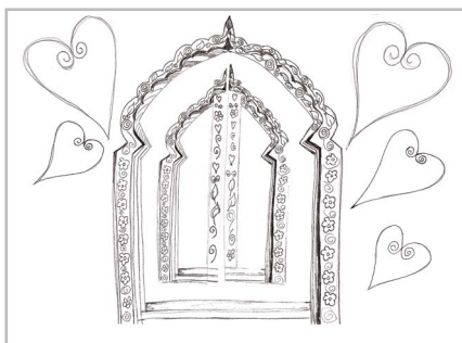
Dessin 1 : la porte fermée

OUVRONS LA PORTE ! INVITER UN ENFANT À OUVRIR LA PORTE SUR LE PANNEAU