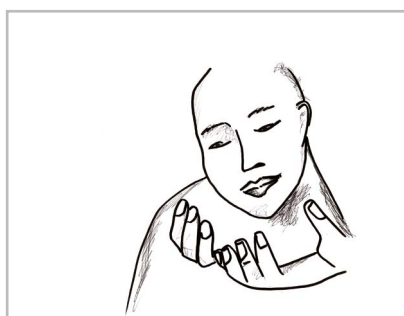
Dessin 2 : le visage