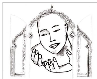
3. Effet après ouverture de la porte

Sur le visage qui est apparu, nous mettrons des couleurs au cours de la messe, pour signifier qu'il y a de la vie et de la joie à ouvrir nos cœurs pour aller vers Jésus.