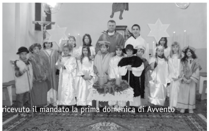
A Cadro e Davesco, 4 gruppi di Cantori hanno ricevuto il mandato la prima domenica di Avvento