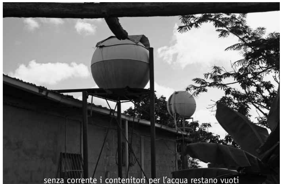
senza corrente i contenitori per l'acqua restano vuoti